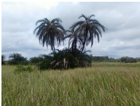
Savane incluse dans le parc