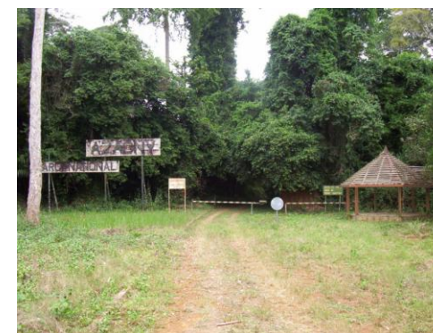
Une des entrées du parc