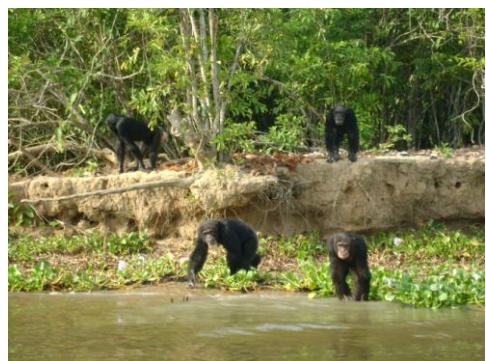
Île aux Chimpanzés