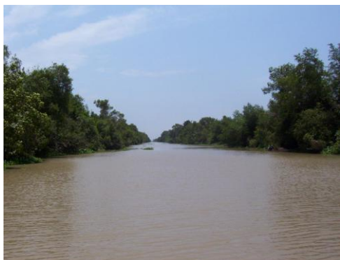
Le canal d'Azagny