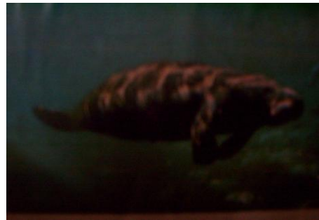
Le lamantin Ouest africain localisé dans le plan d'eau du parc