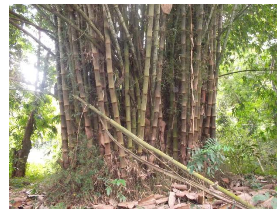
Une vue des Bambous