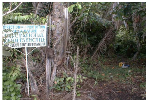
Entrée du sentier botanique