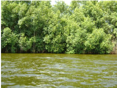
Mangrove du parc