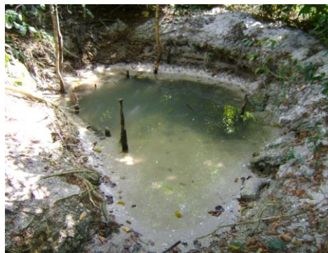
Une source d'eau potable dans le parc

REPUBLIQUE DE CÔTE D'IVOIRE Union-Discipline-Travail