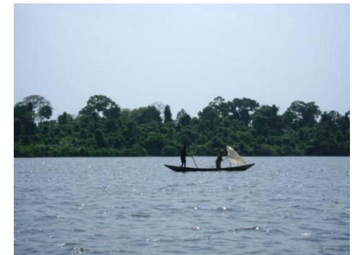
Pêcheurs devant l'une des six îles du parc