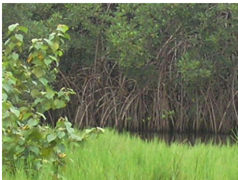
Végétation de Sesuvium porulacastrum juxtaposée à la végétation de mangrove démontrant la diversité de la végétation du parc