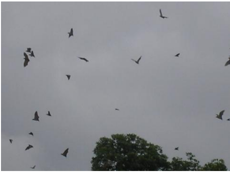
Envol d'une colonie de Chauves souris sur l'île Balouaté