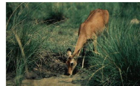
Un Cobe de buffon