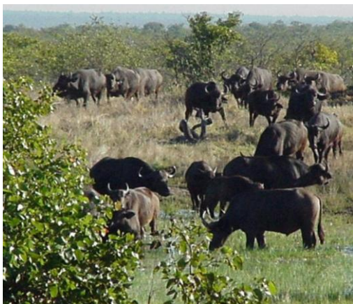
Une colonie de buffles