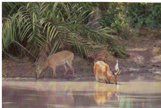
Deux Cobes s'abreuvant