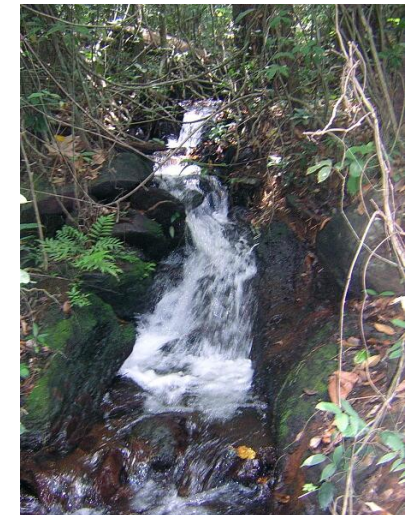
Une vue des cascades