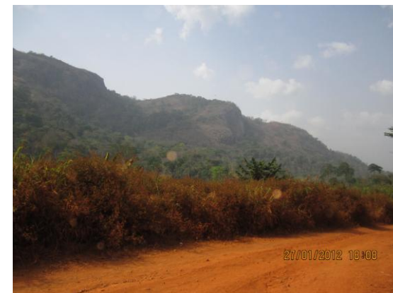
Une vue du Mont Péko