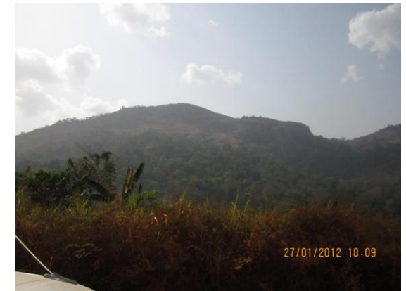
Une vue du Mont Péko