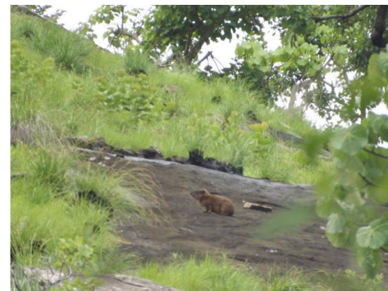
Daman des rochers