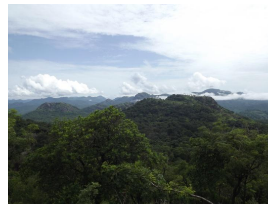
Monts au sud du Bafing