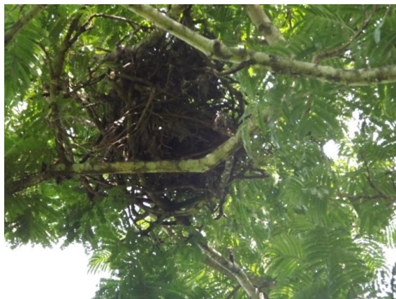
Nid de Chimpanzés