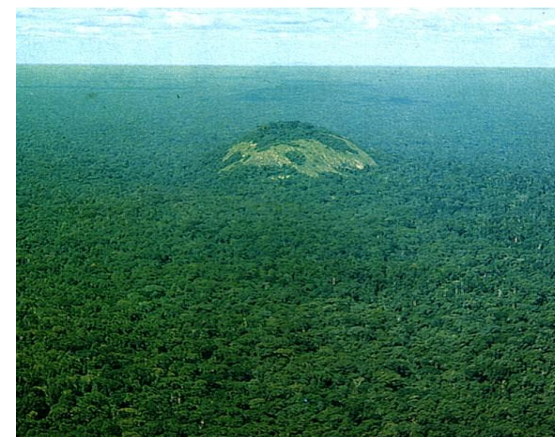
Un aperçu du Mont Niénokoué, la plus grande altitude du parc (396 m)