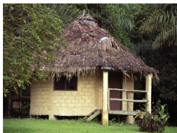
Un aperçu de l'écotel, une infrastructure pur l'accueil des touristes du parc