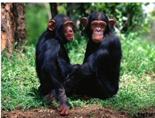
Un couple de Chimpanzé à l'intérieur du parc