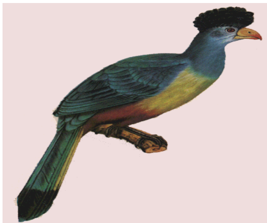
Le touraco à bec gros