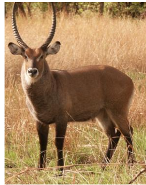
Un Cob defassa