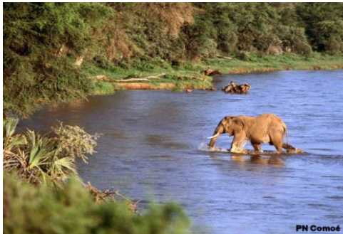
Un Eléphant dans le fleuve Comoé