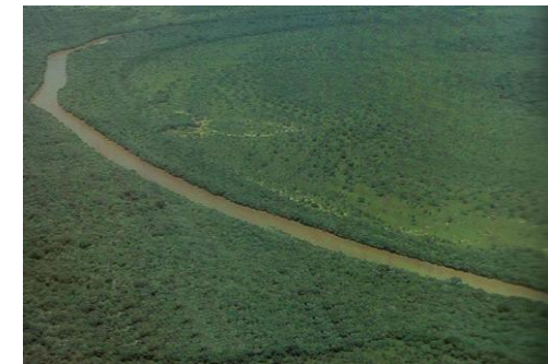
Vue aérienne du fleuve Comoé traversant le parc