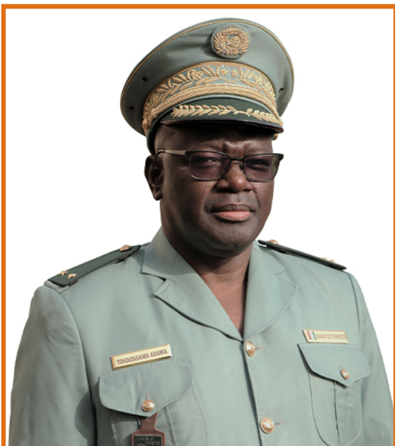
Général TONDOSSAMA Adama Directeur Général de l'OIPR

Ainsi, à la Fondation pour les Parcs et Réserves de Côte d'Ivoire, j'exprime toute ma reconnaissance pour son appui inestimable pour la gestion des parcs nationaux de la Comoé, de Taï, d'Azagny et du Mont Sangbé.