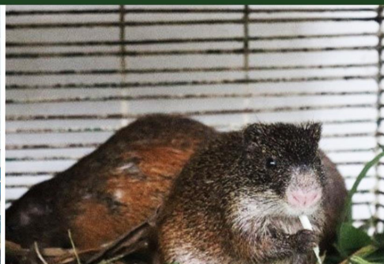
PROMOUVOIR L'AULACODICULTURE COMME ALTERNATIVE AU BRACONNAGE A LA PERIPHERIE DU PARC NATIONAL D'AZAGNY