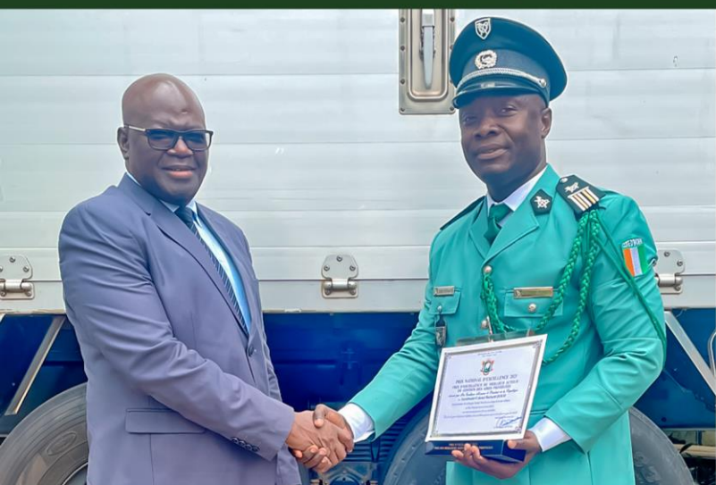
LIEUTENANT-COLONEL RICHARD ZOUO REÇOIT LE PRIX NATIONAL D'EXCELLENCE DU MEILLEUR ACTEUR DE GESTION DES AIRES PROTÉGÉES