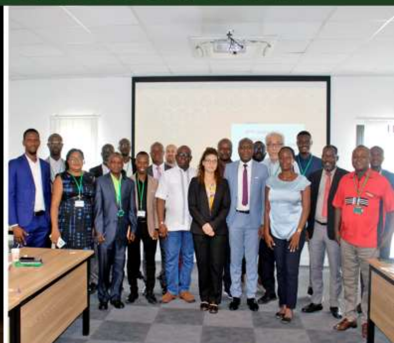
SCHÉMA DIRECTEUR DE L'URBANISATION DU GRAND ABIDJAN À L'HORIZON 2040 : L'OIPR PLAIDE POUR LA SÉCURISATION TOTALE DES ASSISES FONCIÈRES DES AIRES

LA RÉSERVE NATURELLE DE CAVALLY AU CŒUR DU DÉBAT-THÉÂTRE ORGANISÉ PAR WILD CHIMPANZEE FONDATION ET ALMA PRODUCTION.