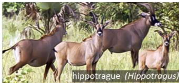
hippotrague ( Hippotragus )

Pour rappel, la distance de fuite traduit l'état de crainte ou de peur de l'animal en présence de l'Homme et pourrait évaluer le niveau d'agression d'une aire protégée. Les études traitant cette thématique sont rares dans la littérature. Il sera donc difficile d'avoir des éléments de comparaison et donc limitées à une simple interprétation des données. La distance moyenne de fuite la plus faible mesurée dans le cadre de la présente étude a été celle des cobes de Buffon ( 59,4 \pm 29,9 m). Cette distance est relativement plus faible que celle du Bubale et de l'Hippotrague. On peut alors déduire qu'au Parc national de Comoé, les cobes de Buffon ont une tendance à accepter la présence humaine en véhicule dans la limite de 60 m. En deçà de cette distance, les cobes pourraient prendre la fuite. La plus grande distance moyenne de fuite enregistré concerne celle de l'hippotrague ( 79,6 \pm 31,8 m).