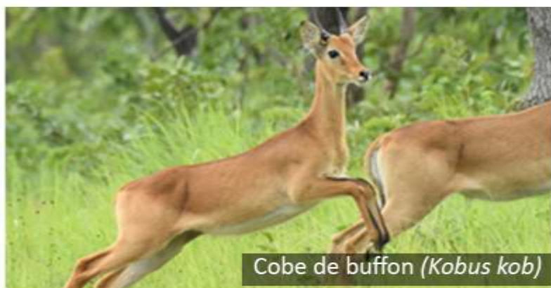
Cobe de buffon ( Kobus kob )

Le Parc national de la Comoé a pour vocation première le développement du tourisme de vision. Ainsi, une bonne connaissance du comportement des animaux en présence des visiteurs paraît fondamentale. C'est dans cette optique qu'une évaluation de la distance de fuite au cours du premier trimestre 2024 a été réalisée. Trois espèces animales principales (Bubale, Cobe de Buffon et Hippotrague) ont été ciblées par cette évaluation.