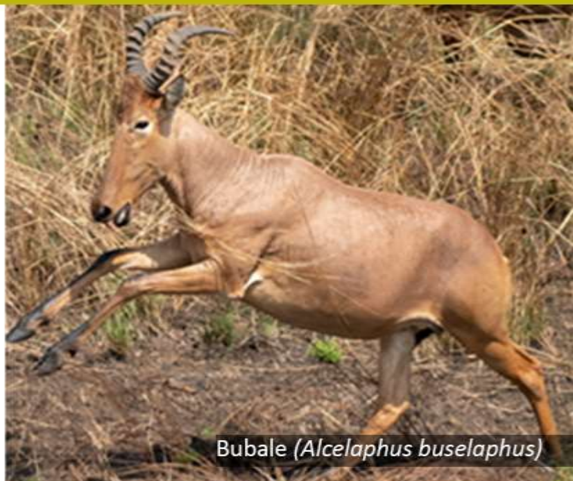
Bubale ( Alcelaphus buselaphus )

Les résultats de cette première étude d'évaluation de la distance de fuite indiquent que le Cobe de Buffon et le Bubale ont une distance de fuite variant autour de 60 m. Ces deux espèces sont relativement moins craintives que l'hippotrague.