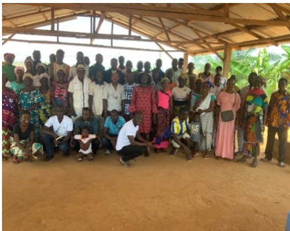
Représentants des populations de Gliké