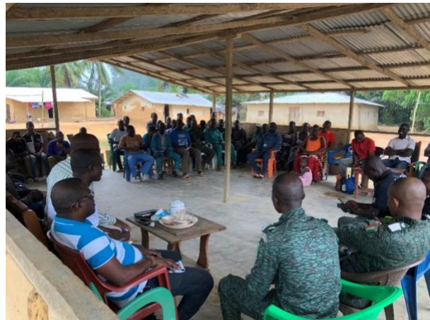
Réunion avec les populations de Magnéry