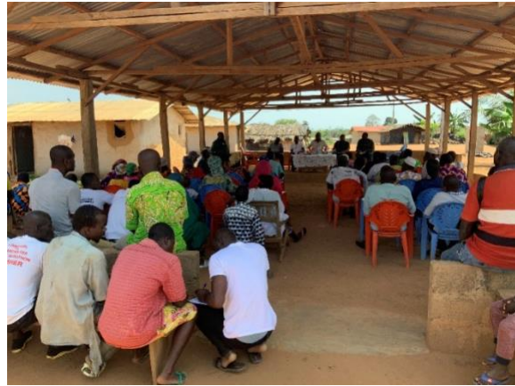
Réunion avec les populations de Nero-Brousse