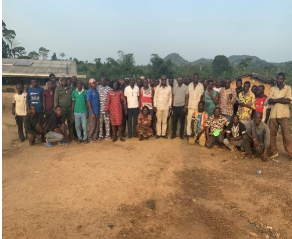
Représentants des populations de Nero Brousse