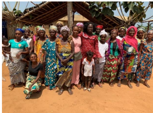
Représentantes des femmes de Magnéry