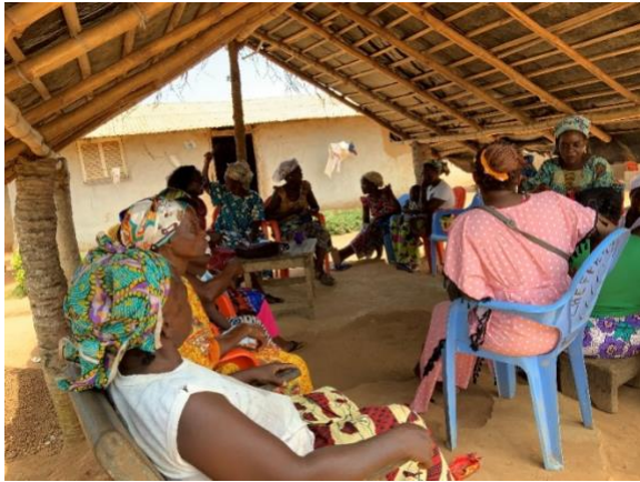
Réunion avec des femmes e Gliké