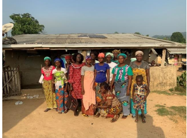
Représentantes des femmes de Nero-Brousse