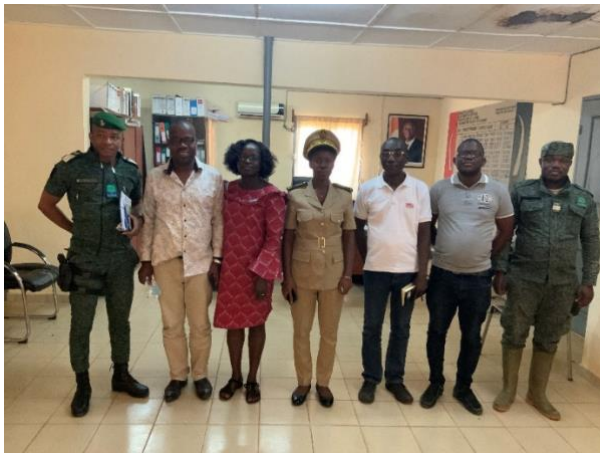
Rencontre avec la Sous-Préfet de Grand-Béréby