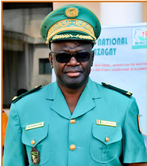
Général TONDOSSAMA Adama Directeur Général de l'OIPR

P our l'année 2024, je voudrais formuler des vœux de santé et de prospérité et surtout de paix profonde à l'ensemble du personnel de l'OIPR et à l'ensemble de nos partenaires. Je voudrais en l'entame de l'année 2024, faire d'abord le bilan de l'exercice 2023. Pour ce qui concerne la gestion du réseau des aires protégées de Côte d'Ivoire, il faut noter que l'état de conservation des parcs nationaux est globalement satisfaisant avec les parcs qui sont dans un excellent état notamment le Parc national de la Comoé, le Parc national de Taï et le Parc national du Banco.